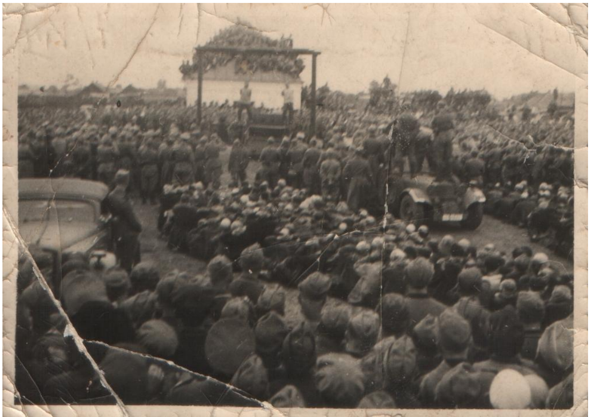
Перша страта в Житомирі. 07.08.1941 рік.