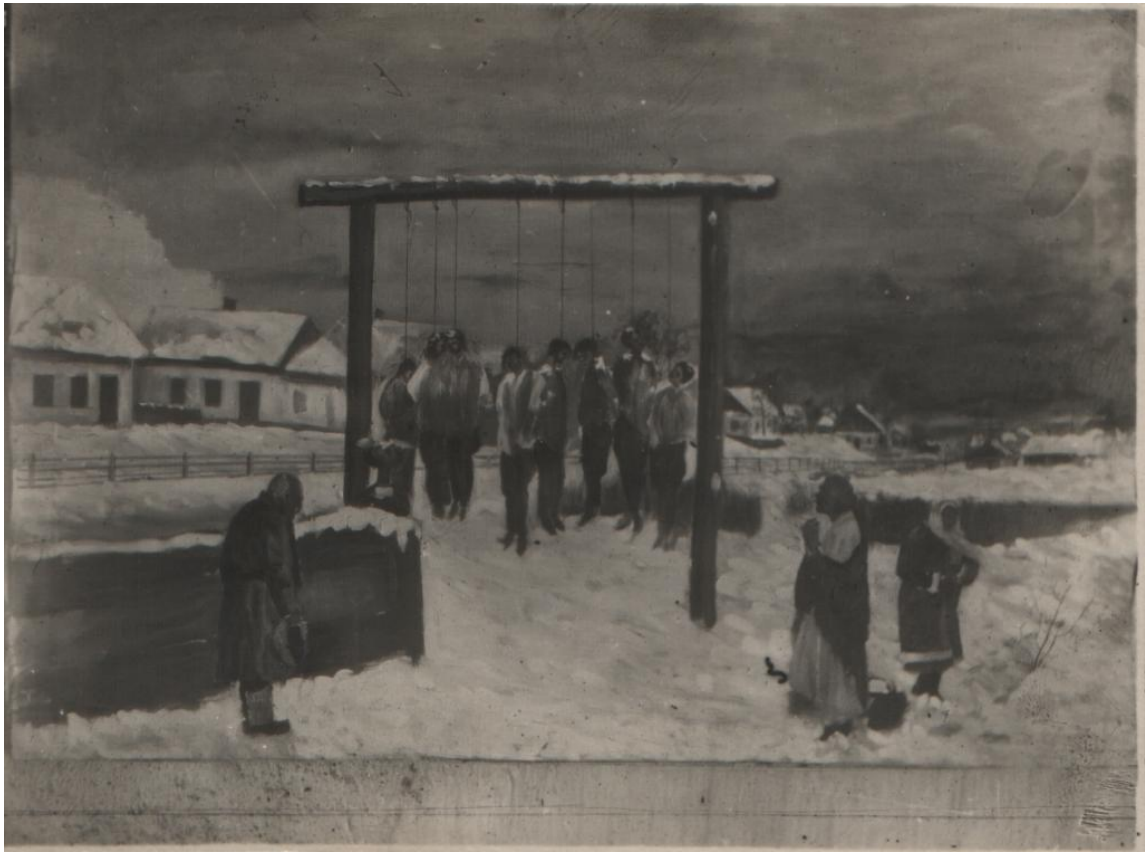
Група повісених партизан та членів підпільної організації м. Новоград-Волинський. 1943 рік. 266-3в.