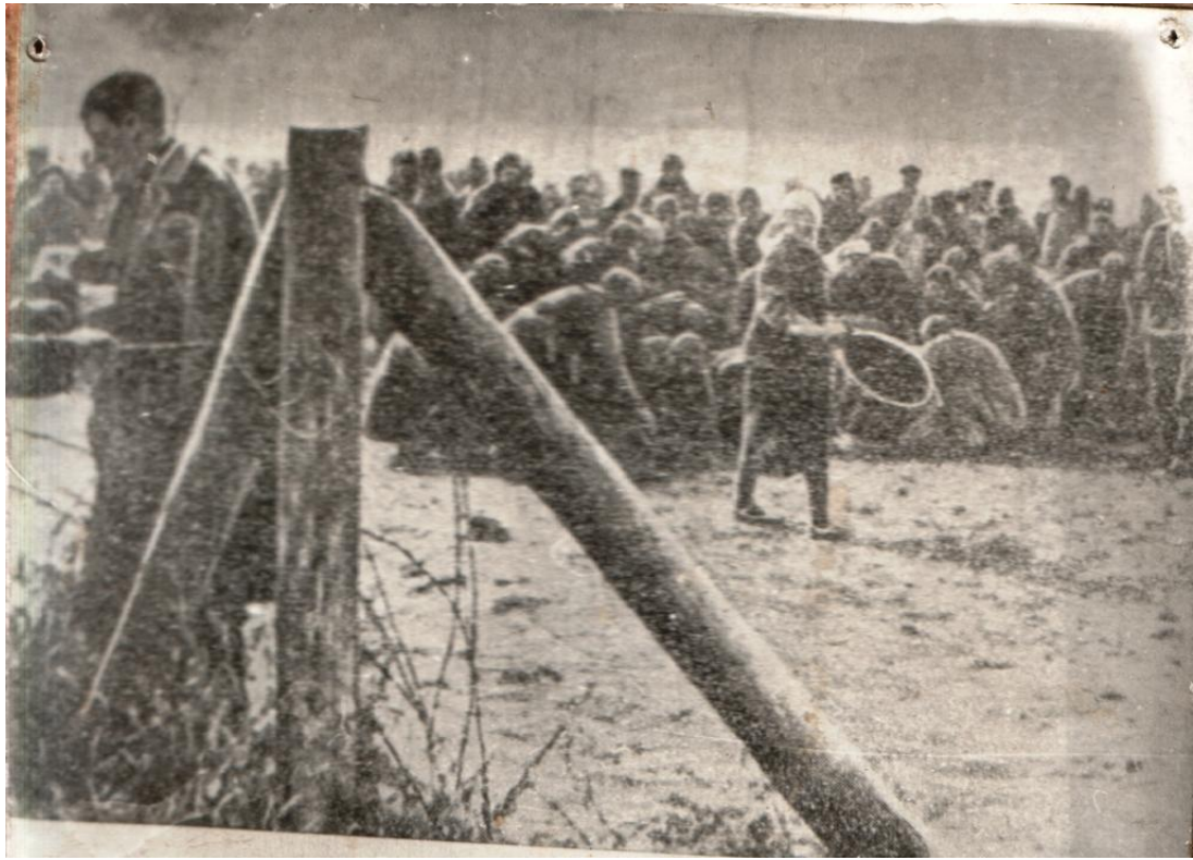
Концентраційний табір, утворений фашистськими окупантами під Житомиром. Реєстр. № 16699.