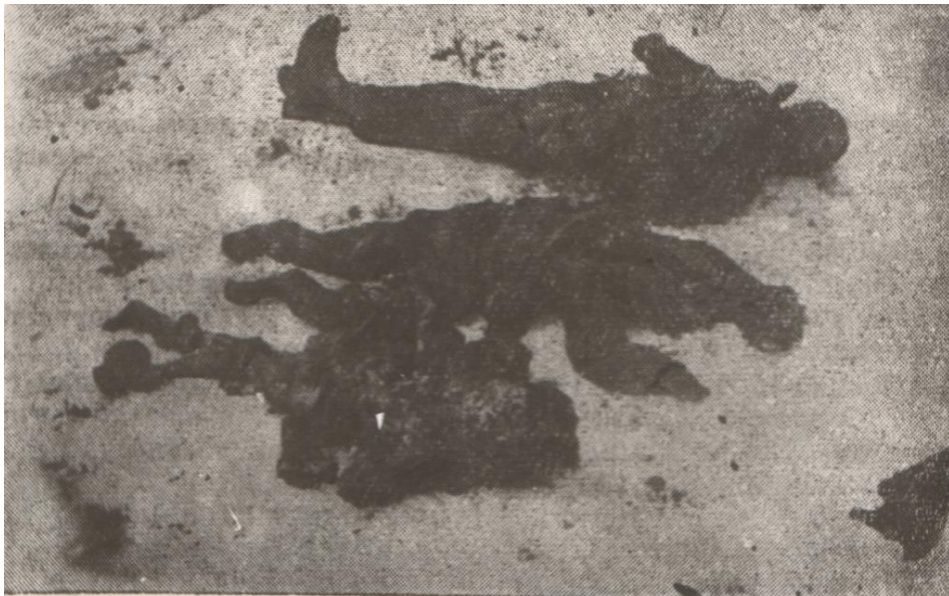
Трупи радянських дітей, убитих фашистськими загарбниками на хуторі Довжик. 1943 рік. Реєстр. № 16493.