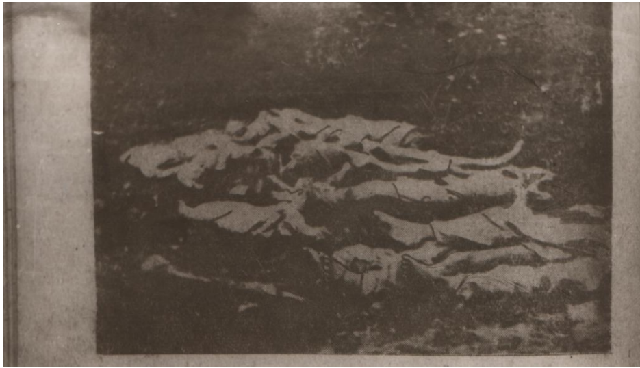
Трупи радянських військовополонених, що загинули у німецькому таборі на Богунії. 1943 рік. Реєстр. № 16492.