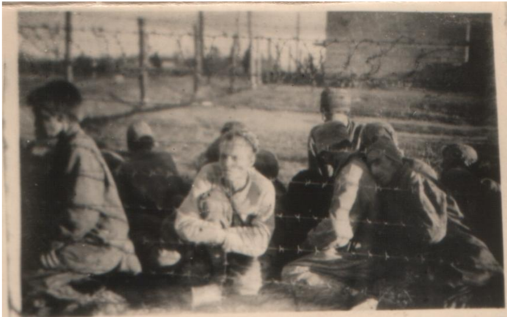
Табір військовополонених на Богунії. 1942 рік. Фототека ДАЖО. Реєстр. № 10459