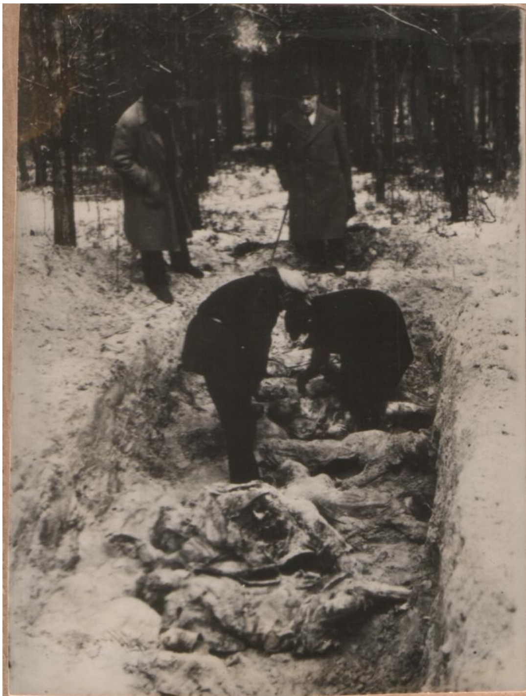
Члени обласної комісії судово-медичних експертів біля розкопаної ями, де поховані радянські громадяни, розстріляні фашистськими окупантами. 1944 рік. Фототека ДАЖО. Реєстр. № 7448