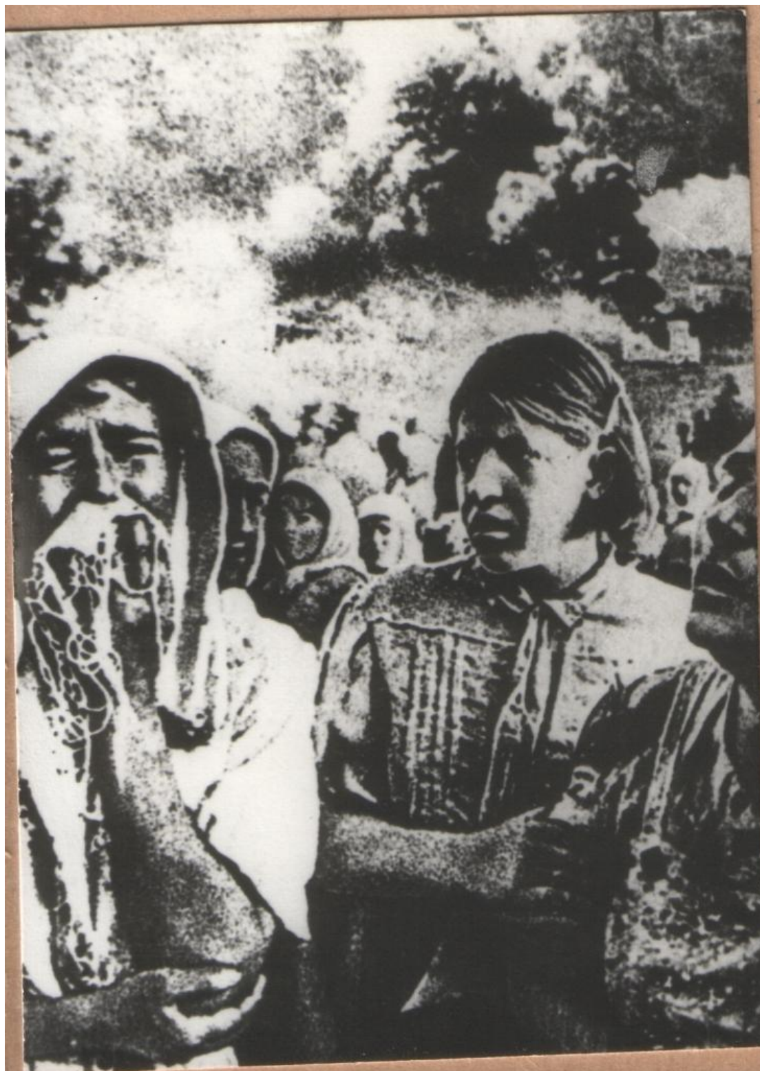
Радянські громадяни під фашистськими бомбами. 1942 рік. Фототека ДАЖО. Реєстр. № 12967а.