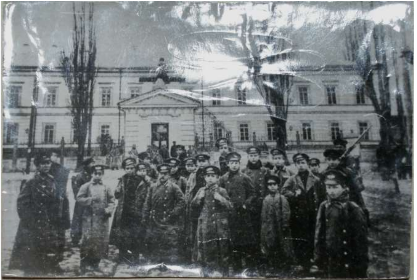
Фото приміщення першої Житомирської чоловічої гімназії 1912 рік. (фототека інв.№ 8645).