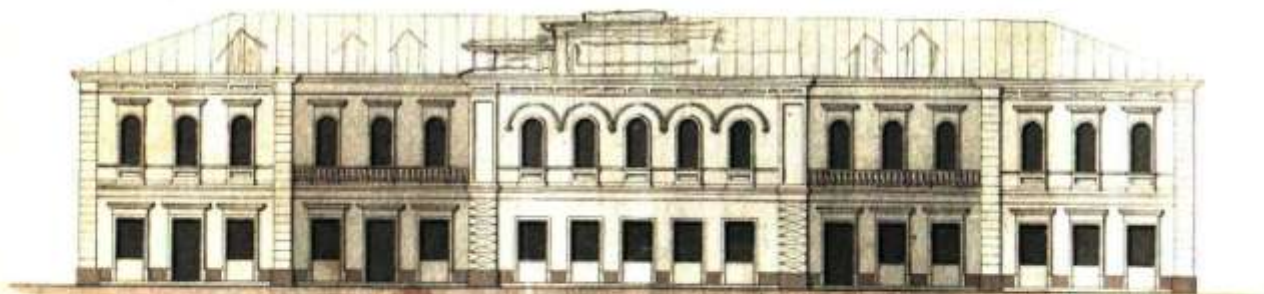
Загальний вигляд Житомирської Маріїнської гімназії, Ф. 74, оп. 1, спр. 98