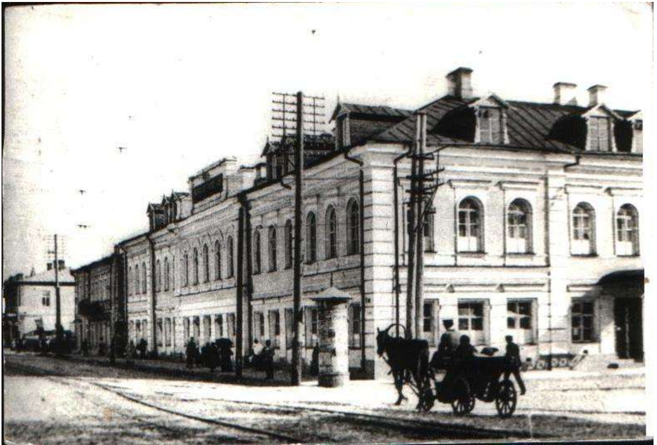
Фото будівлі Житомирської Маріїнської гімназії (нині майдан Корольова, 10, м. Житомир), Фотофонд ДАЖО, № 8372